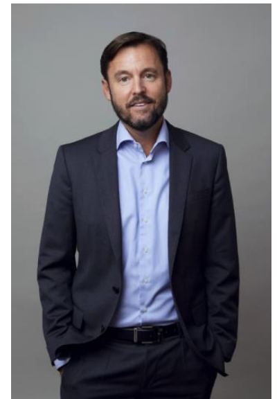
Johan Forssell, VD Investor AB

Sedan 2005 har Jacob Wallenberg suttit som Styrelseordförande. Jacob är en utav Sveriges mest framgångsrika affärsmän och har en lång meriterad karriär bakom sig. Han har bland annat varit Koncernchef och VD för SEB, Vice ordförande på Atlas Copco, Investor och SAS. Jacob har även varit den enda icke-amerikanska ledamoten i Coca-Cola Companys styrelse. Han sitter tungt investerad i Investor med 146 669 A-aktier och 315 572 B-aktier. Totalt består styrelsen av fyra kvinnor och sex män.