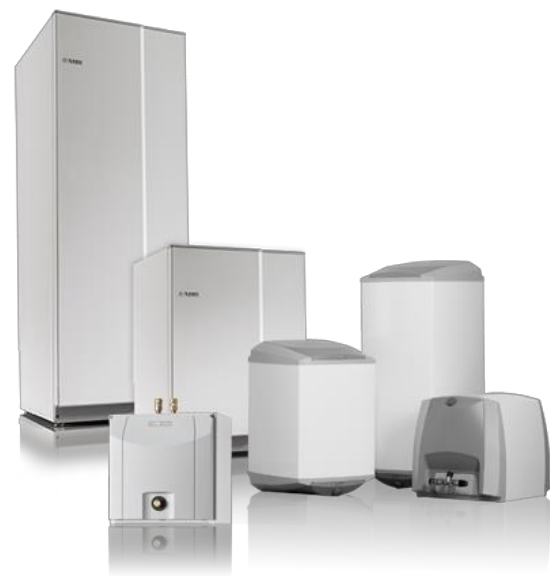
Figure 4: NIBE Water heaters