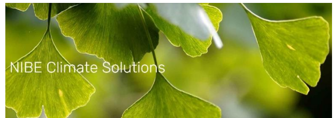
Figure 1: NIBE Climate Solutions

NIBE har fortsatt starka siffror och har en stark position på marknaden. De fortsätter att leverera starkare siffror än någonsin där de ökade sin orderingång med 16% (13,5% organisk) under perioden Jan-Jun 2021 jämfört med 6% under samma period 2020. Vinstmarginalen ökade till 14 (+2%) sett till samma period förra året som var 12%. NIBE fortsätter att ta marknadsandelar i Norden, Europa och Nordamerika. Tack vare att alla dessa världsdelar har satt fokus på hållbarhet så är en framtida tillväxt för bolaget sannolik och i och med deras etablering på flera marknader så har de goda möjligheter att ta sig an fler marknadsandelar. I och med NIBE's geografiska spridning på alla affärsområden så är de starka mot eventuella lokala händelser som kan påverka försäljningen. Vidare investerar NIBE omkring 2% (600 MSEK) av deras omsättning i organisationen vilket tyder på en ledning som är villig att utveckla organisationen. NIBE ligger med sin nuvarande produktarsenal rätt i tid och har stora möjligheter att öka sina marginaler.