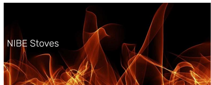
Figure 3: NIBE Stoves