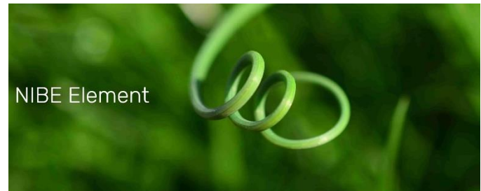
Figure 2: NIBE Element